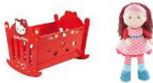
Vugge – dukke